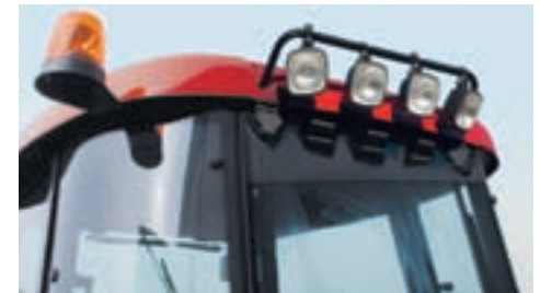
▲ Rotorblink og arbejdslygter giver ekstra sikkerhed på landveje og i marken.

Giver ikke op, før opgaven er fuldført. I travle perioder, hvor der arbejdes til sent, kan du altid stole på JX. Med op til seks tagmonterede arbejdslygter og et rotorblink til landevejskørsel, er der ingen problemer, når mørket falder på.