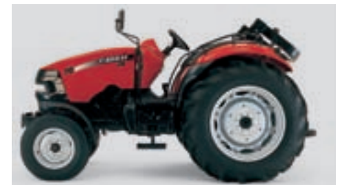
▲ Den nedfoldelige ROPS giver uhindret adgang til lave bygninger.