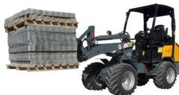
Giant 452 X-tra