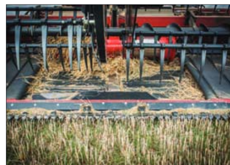
Case IH Sejlskærebordet har hydraulisk centertræk.